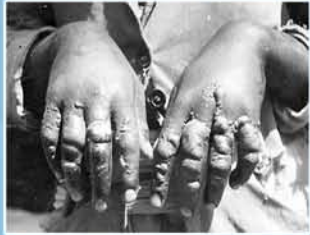
سوختگی های ایجاد شده در اثر کاربرد گاز شیمیایی در تهاجم به اتیوپی ۶-۱۳۰۵ ۳۶-۱۹۳۵)