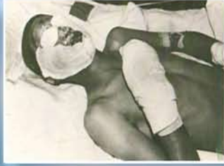
رزمنده ایرانی مجروح با گاز خردل