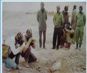
عکسبرداری تیم تحقیق سازمان ملل از بمب های شیمیایی عراق