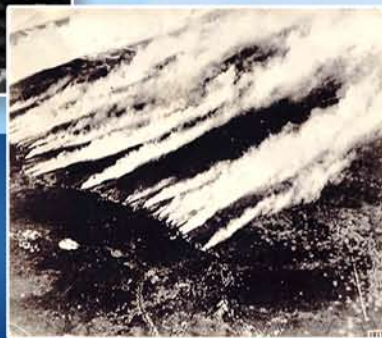
حمله گاز کلر که از پشت جبهه آلمانی ها در جنگ جهانی اول عکسبرداری شده است.